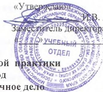
График учебной и производственной практики на 2020-2021 учебный год специальность 43.02.14 Гостиничное дело